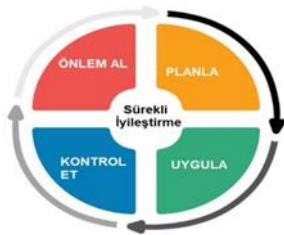
Şekil 1. PUKÖ Döngüsü

Sektörün durumu, çevresel, toplumsal, teknolojik, ekonomik ve kültürel riskler, mevzuat kaynaklı değişiklik ve güncellemeler dolayısıyla yönetim sistemimiz sürekli gözden geçirilmekte, gerekli olması durumunda sistem ve politikalar güncellenmektedir.